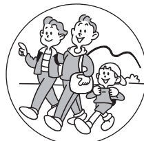
旅行など環境の変化で おなかの調子をくずしたときに