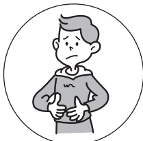
おなかの弱い方の 整腸に