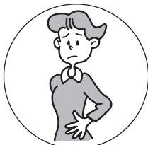
おなか はったときに